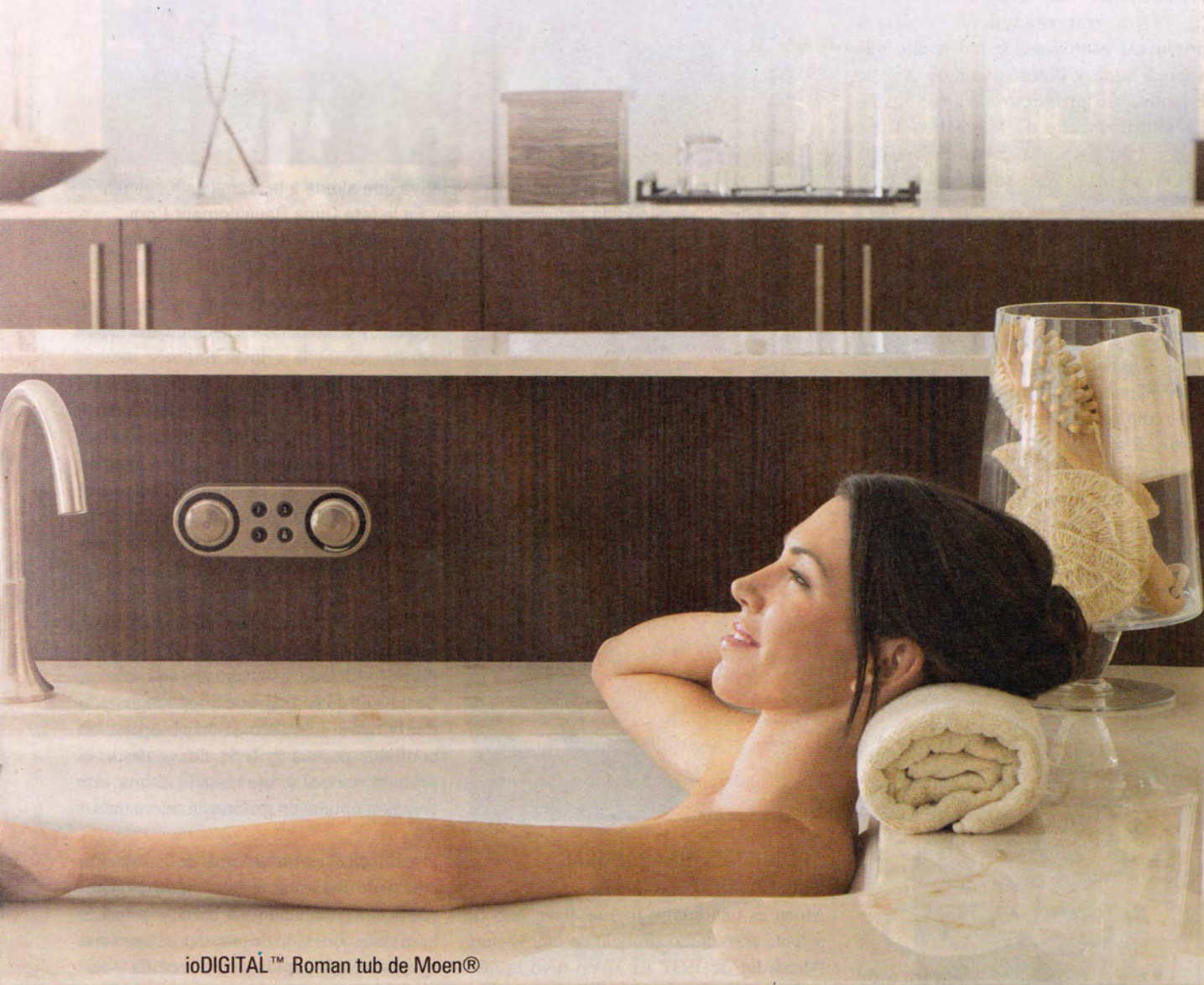
ioDIGITAL™ Roman tub de Moen®